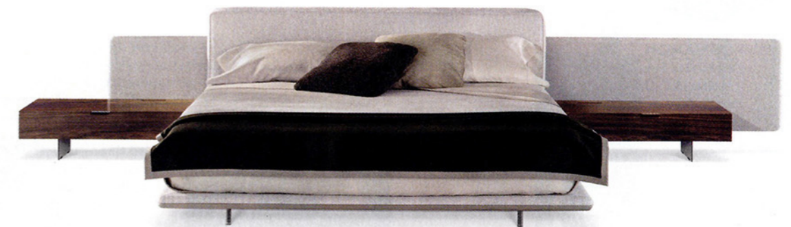
HORIZONTE by Marcio Kogan/studio mk27 per Minotti. L'orizzontalità contraddistingue la composizione che include sommier, contenitori in legno e testata e pannello posteriore rivestiti in tessuto. minotti.com