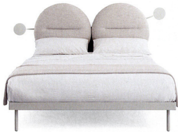
BISHAPE by Monica Graffeo per Caccaro. Testata imbottita da comporre abbinando moduli rettangolari o tondi. caccaro.com

Design per il riposo studiato nei dettagli, con uno sguardo alla sostenibilità. E un'attenzione alle proporzioni e alle geometrie