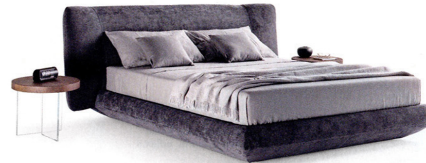
BED-IN by Mauro Lipparini per Lago. Imbottito e rivestito in tessuto sfoderabile. Nella versione a terra, sospeso e con contenitore. lago.it