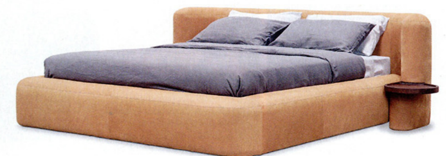
CLARA by Christophe Delcourt per Baxter. Dalle linee arrotondate, testata e giroletto imbottiti in morbida pelle Nabuk Camel. baxter.it